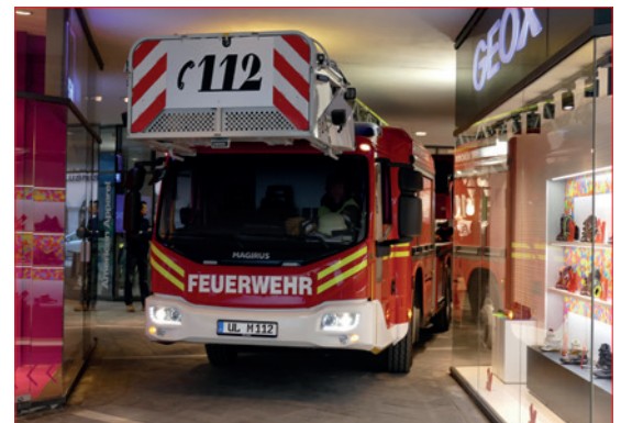
Hohe Wendigkeit selbst bei beengten Verhältnissen