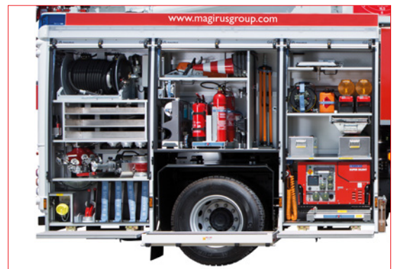
Ausstattung (exemplarische Darstellung)