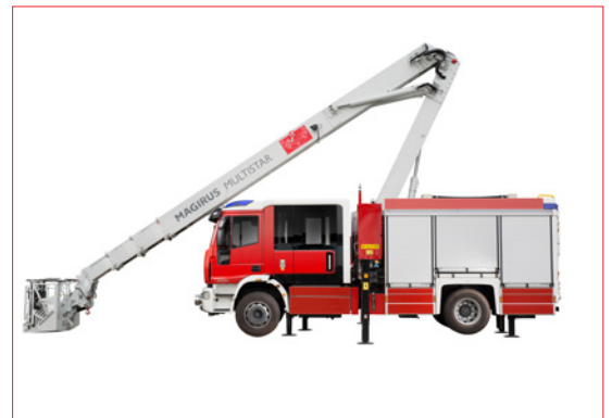
Teleskopmast mit Einsatzbereich von -12 m bis +30,5 m

Abbildungen können zusätzliche Optionen enthalten. Wir behalten uns das Recht vor, jederzeit ohne Vorankündigung technische Änderungen oder Verbesserungen vorzunehmen. Irrtümer vorbehalten.